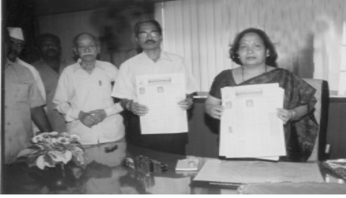
कल्याणवार्ता प्रथम अंक सप्टेंबर, ०७ चे प्रकाशन करताना मा. महापौर

कल्याणवार्ता सप्टेंबर २००७ च्या अंकाचे प्रकाशन मा. महापौर यांच्या शुभ हस्ते दिनांक २८/०९/२००७ रोजी त्यांच्या दालनात झाले. प्रकाशन कार्यक्रमाच्या वेळी कल्याणवार्ताचे संपादक